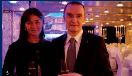
7 Conférence orthopédie, Clinique de Montchoisi, Lausanne, mars 2011